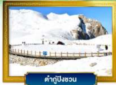
คำตู้ปังชวง

ช้อปปิ้งจุดถนนคนเดินชุนซีลู่, ถนนไท่กู่หลี่