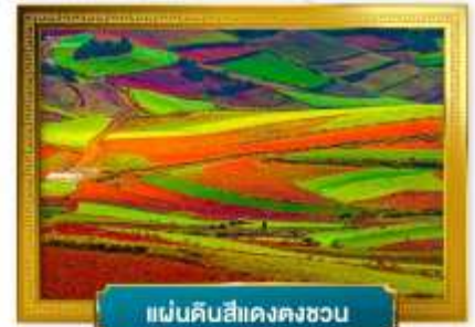
แผ่นดินสีแดงตงชวน