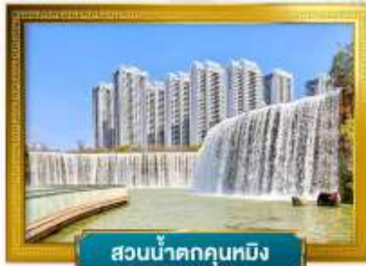
สวนน้ำตกคุนหมิง