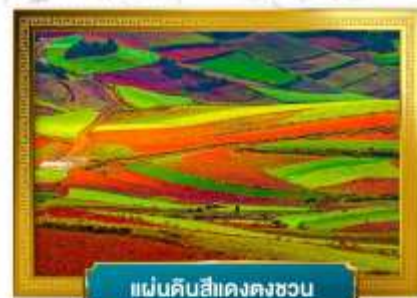
แผ่นดินสีแดงตงชวน