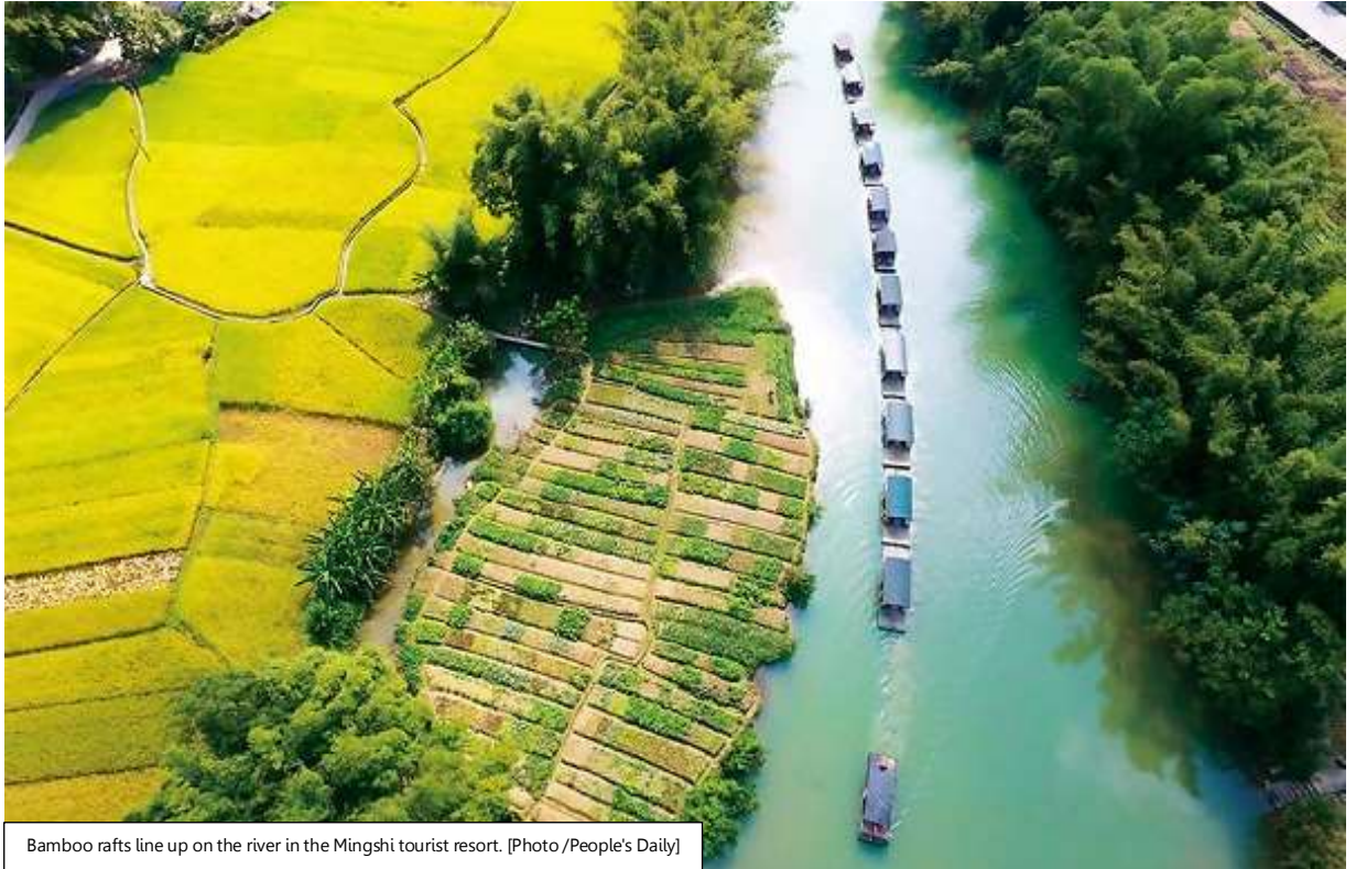
Bamboo rafts line up on the river in the Mingshi tourist resort.

รถบัสนำท่านไปส่งที่ท่าแพต้นน้ำ เพื่อให้ท่าน ลองแพไม้ไผ่หมิงซื่อเกียนเหยียน ชมทัศนียภาพสองฝั่งลำน้ำ และบรรยากาศอันสดชื่นที่มีภูเขาที่เป็นฉากหลัง ที่เรียกว่า "วิวภาพเขียนร้อยลี้" วิวนี้โด่งดังเพราะ มีซีรีส์ทีวี "ฮวาเซียนกุ" มาถ่ายทำที่นี่ ขณะลองแพท่านจะได้พบเห็นวิถีชีวิตของชาวล้วงชนบท ที่ออกมาทำกิจกรรมประจำวัน เมืองจิ่งซีมีอากาศเย็นสบายและมีทัศนียภาพทางธรรมชาติสวยงามคล้ายเมืองกุ้ยหลิน