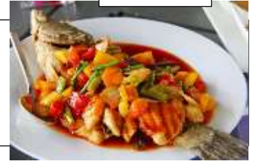
รูปภาพประกอบ

หลังอาหารนำเที่ยว เมืองโบราณไทผิง Taiping Ancient Town 崇左太平古城 ตั้งอยู่ในเขตฉางฉางเจิง เจียงโจวตะวันตกเฉียงใต้ บริเวณตอนกลางของแม่น้ำจั่วเจียง เมืองฉางฉาง ครั้งหนึ่งเคยเป็นที่ตั้งของเมืองโบราณคฤหาสน์ไทผิง มีประวัติยาวนานกว่าพันปี ในรัชสมัยของจักรพรรดิไท่จงแห่งราชวงศ์ซ่ง ต่อมาราชวงศ์หยวน หมิง และชิง ได้ตั้งถิ่นฐานที่นี่ เมืองโบราณไทผิง ประกอบด้วย 3 วัฒนธรรม ได้แก่ วัฒนธรรมฉาง วัฒนธรรมน้ำตาล และวัฒนธรรมทางน้ำ