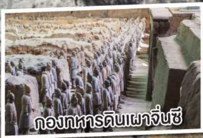
กองทัพดินเผาจิ๋นซี