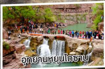
อุทยานหยุนโกซาน