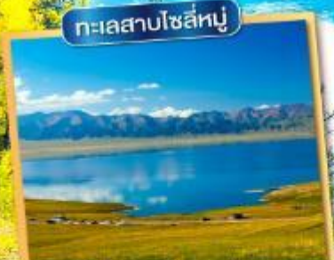
ทะเลสาบไซลีหนู

ประกันสุขภาพอุบัติเหตุ คุ้มครองสูงสุด 3,000,000