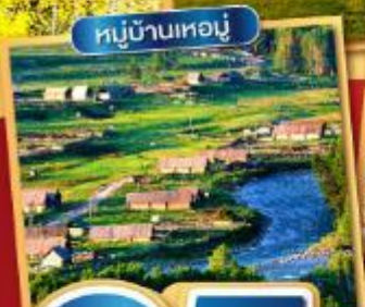
หมู่บ้านเหอหนู