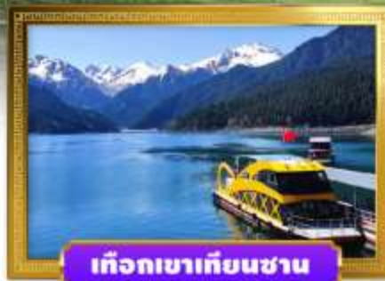
เทือกเขาเทียนชาน