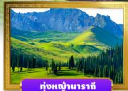
หุบเขานาราตี