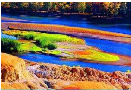
หาดธารน้ำห่าลี