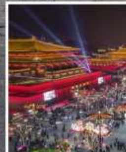
ถนนคนเดินวัฒนธรรมต้าถิง