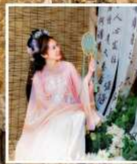
เมืองโบราณลั่วอี้