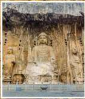
พระพุทธรูปแกะสลักหีบ หลงเหมิน