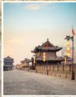
กำแพงเมืองซีอาน