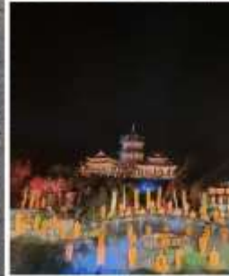
โชว์ SHAOLIN MUSIC CEREMONY