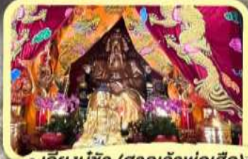
• เอียงบู๊ซิว (ศาลเจ้าพ่อเสือ)