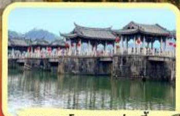
• สะพานโบราณกว้างจี้