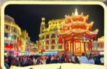
• ถนนโบราณเสี่ยวกงหยวน