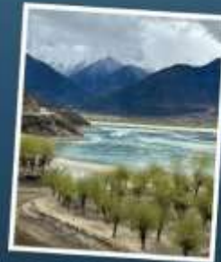
อุทยานเขาเป็นยี่