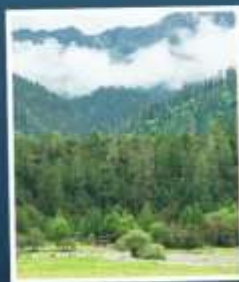
ทะเลป่าหลู่กลาง