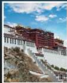
พระราชวังโปตาลา