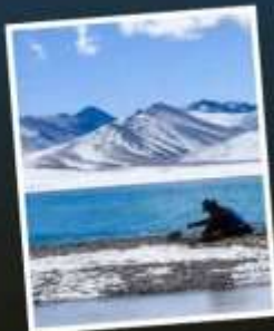
ทะเลสาบน่านมู่ซิว