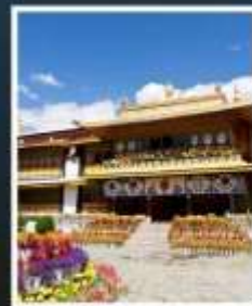
ท่าหนักนอร์บุหลิงฆา