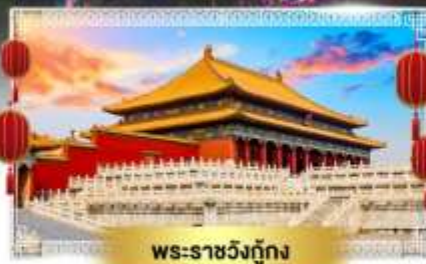
พระราชวังกู้กง