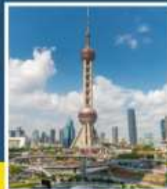
หอคอยไข่มุก