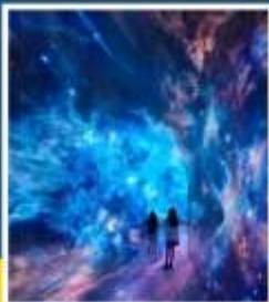
SPACE & TIME CUBE