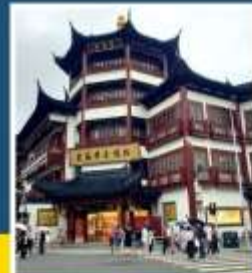
เจียงหวังเมี่ยว