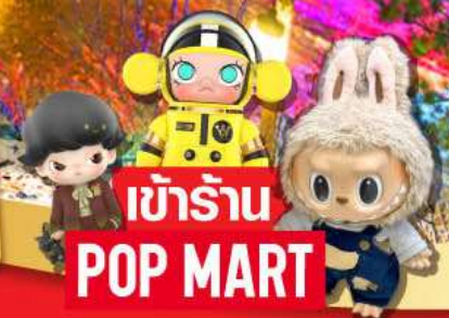
★ เข้าร้าน POP MART