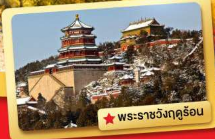
★ พระราชวังฤดูร้อน