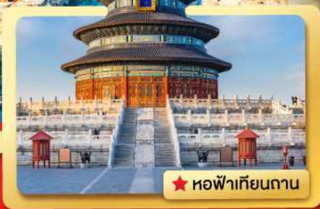
★ หอฟ้าเทียนถาน