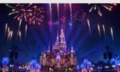
เซี่ยงไฮ้ดิสนีย์แลนด์