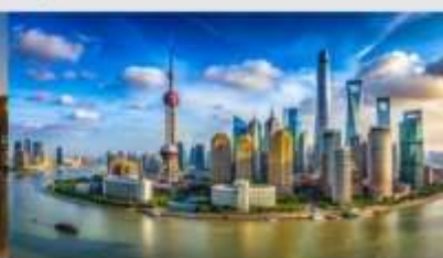
หาดไว่ถาน

*ทางบริษัทฯ ขอสงวนสิทธิ์ในการสลับโปรแกรมทัวร์ตามความเหมาะสมขึ้นอยู่กับสถานการณ์หน่วยงาน โดยคำนึงถึงผลประโยชน์ของลูกค้าเป็นสำคัญ