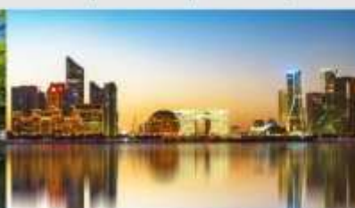
QIANJIANG NEW CITY