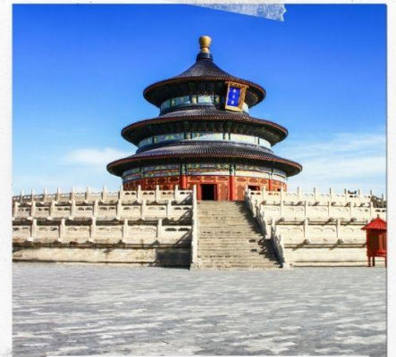
หอบูชาเทียนถาน