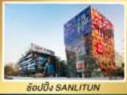
ช้อปปิ้ง SANLITUN