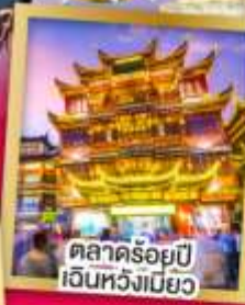
ตลาดร้อยปี เงินหวังเมี่ยว