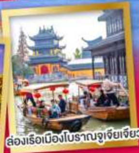
ล่องเรือเมืองโบราณจูเจียเจียว