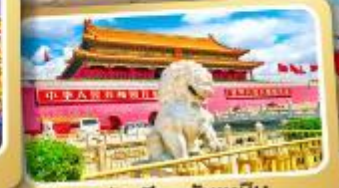
จักรีสเทียนอันเหมิน