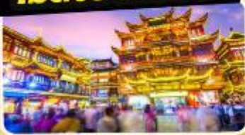
ตลาดร้อยปีเจิ้งหวงเมี่ยว