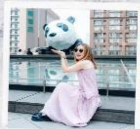
IFS แพนด้าปีนตึก