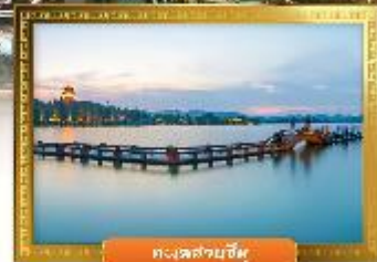
ทะเลสาบอู๋หู