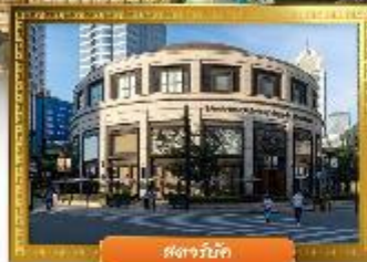
ตงจางมิกซ์

☑️ ช้อปปิ้ง POP MART ถ่ายรูปคู่กันคิมอีักษ์