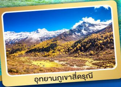
อุทยานภูเขาสีดรุณี