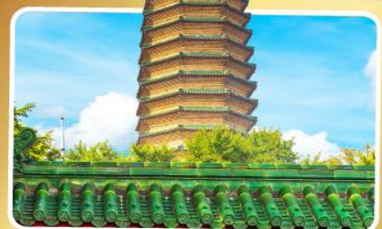
วัดพระเจี๊ยะเก้ว