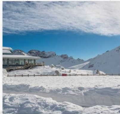
ภูเขาหิมะการ์เซียต้ากุ่ปิงชวน