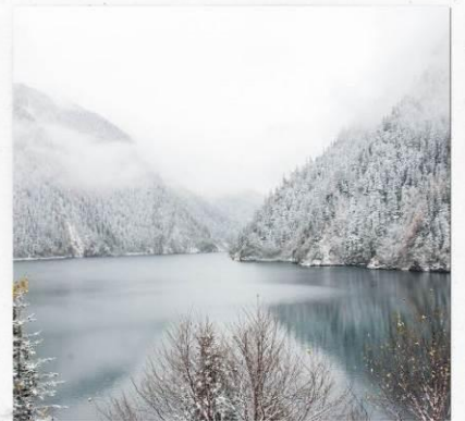
อุทยานจิว่จ้ายโกว