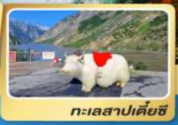
ทะเลสาปเตี้ยซี