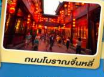
ถนนโบราณจีนหลี