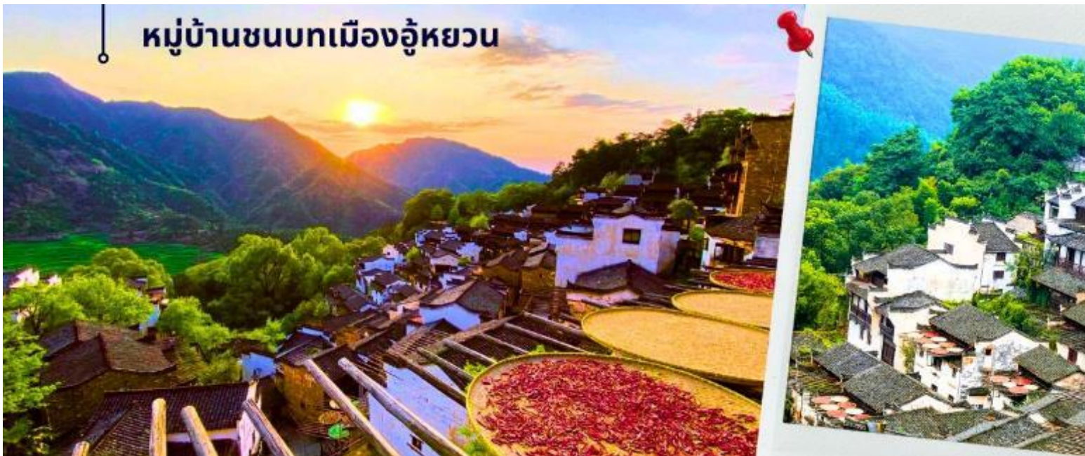
หมู่บ้านชนบทเมืองอู๋หยวน

นำท่านเดินทางสู่ หมู่บ้านชนบทเมืองอู๋หยวน ใช้เวลาเดินทางประมาณ 1.30 ชั่วโมง “เมืองชนบท ที่งดงามที่สุดของประเทศไทย” เป็นเมืองที่ธรรมชาติกลมกลืนกับวิถีชาวบ้านที่เป็นอยู่อย่างเรียบง่ายได้อย่างลงตัว บ้านเก่าแก่ที่อนุรักษ์ไว้อย่างดี สีสันความงามจากธรรมชาติหมุนเวียนไปตามฤดูกาล ทำให้นักท่องเที่ยวได้สัมผัสบรรยากาศที่แตกต่างกันออกไป ตามแต่ฤดูที่มาเยือนเมืองอู๋หยวนแห่งนี้ ซึ่งชาวบ้านยังคงใช้ชีวิตอย่างเรียบง่าย ใช้ชีวิตสบายๆ ริมสายน้ำ ในพื้นที่สีเขียวที่โอบล้อมด้วยภูเขา ด้วยความห่างไกลเมือง และข้อจำกัดเรื่องการเดินทางเข้าถึงในสมัยก่อน ช่วยปกป้องให้อู๋หยวนยังคงรักษาธรรมชาติและวิถีชีวิตแบบดั้งเดิมไว้ได้ แม้ว่าปัจจุบันการเดินทางมาที่อู๋หยวนจะสะดวกสบายขึ้นมาก และการพัฒนายังเข้าถึงทุกหมู่บ้าน แต่โชคที่ผู้คนได้เรียนรู้แล้วว่า พวกเขาโหยหาและยังต้องการให้มีหมู่บ้านที่มีบรรยากาศแบบนี้ต่อไป ดังนั้น อู๋หยวนจึงยังคงความบริสุทธิ์อยู่ได้ ภายใต้กระแสการพัฒนาสมัยใหม่ของจีน