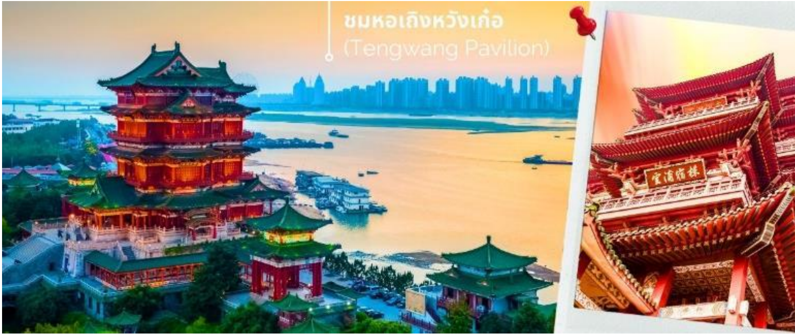
ชมหอเกิงหวังเก้อ (Tengwang Pavilion)

ท่าน ตึกนี้ผ่านการบูรณะมากกว่า 28 ครั้ง ในสมัยยุคซุนตีก ปี ค.ศ. 1926 ตึกนี้ก็ถูกไฟเผาเสียหายโดยซุนตีกชื่อ เต็ง หยู มาในปี 1995 เทศบาลหนานชางจึงทำการสร้างใหม่เป็นตึกคอนกรีตโดยที่ ตึกนี้มีด้วยกัน 9 ชั้น ภายในตกแต่ง