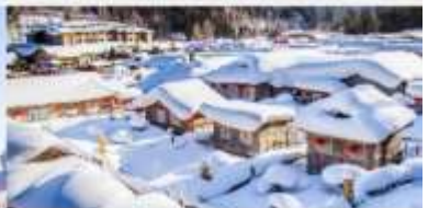
หมู่บ้านหิมะ

*ทางบริษัทฯ ขอสงวนสิทธิ์ในการสลับโปรแกรมทัวร์ตามความเหมาะสมขึ้นอยู่กับสถานการณ์หน้างาน โดยคำนึงถึงผลประโยชน์ของลูกค้าเป็นสำคัญ