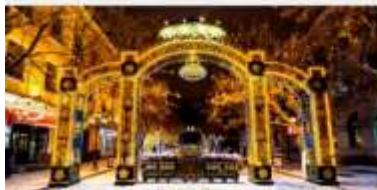
ถนนคนเดินจงหยาง