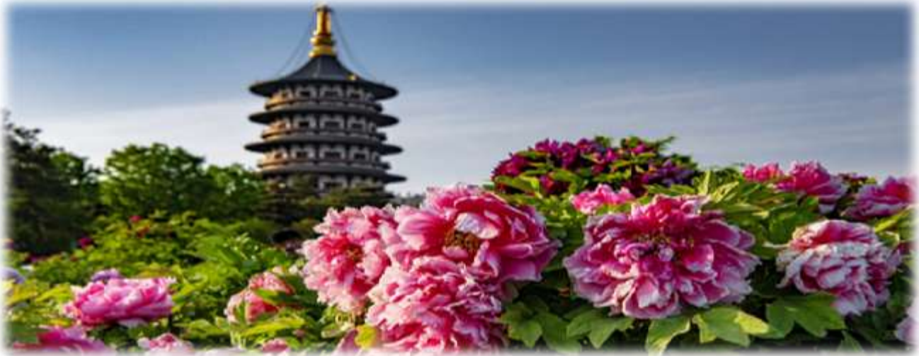
ที่พร้อมใจกันบานสะพรั่งมากมาย

จากนั้นนำท่านเข้า ชมสวนดอกโบตั๋น ที่จะมีจัดงานทุกปี ในช่วงฤดูใบไม้ผลิ ประมาณกลางเดือนเมษายน ถึงกลางเดือนพฤษภาคม โดยเทศกาลชมดอกโบตั๋นที่เมืองลั่วหยางถือว่าเป็น 1 ใน 4 เทศกาลดอกไม้ที่ใหญ่ที่สุดในจีนและมีชื่อเสียงมาก ๆ ในแต่ละปีจะมีนักท่องเที่ยวให้ความสนใจ กับความสวยงาม ของดอกโบตั๋น