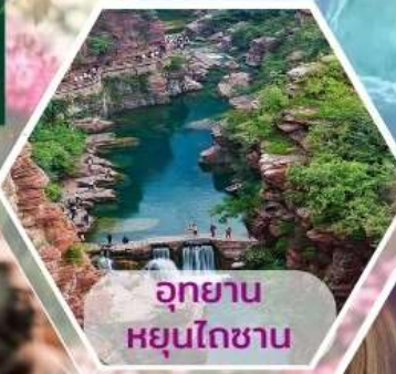
อุทยานหยุนโตซาน