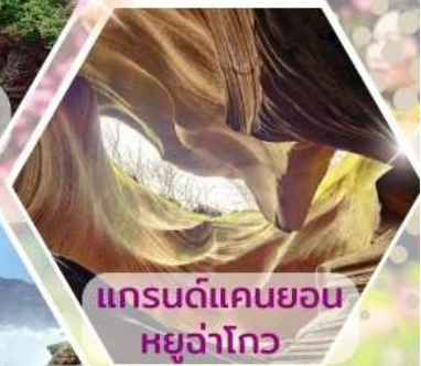
แกรนด์แคนยอนหยูจ่าโกว