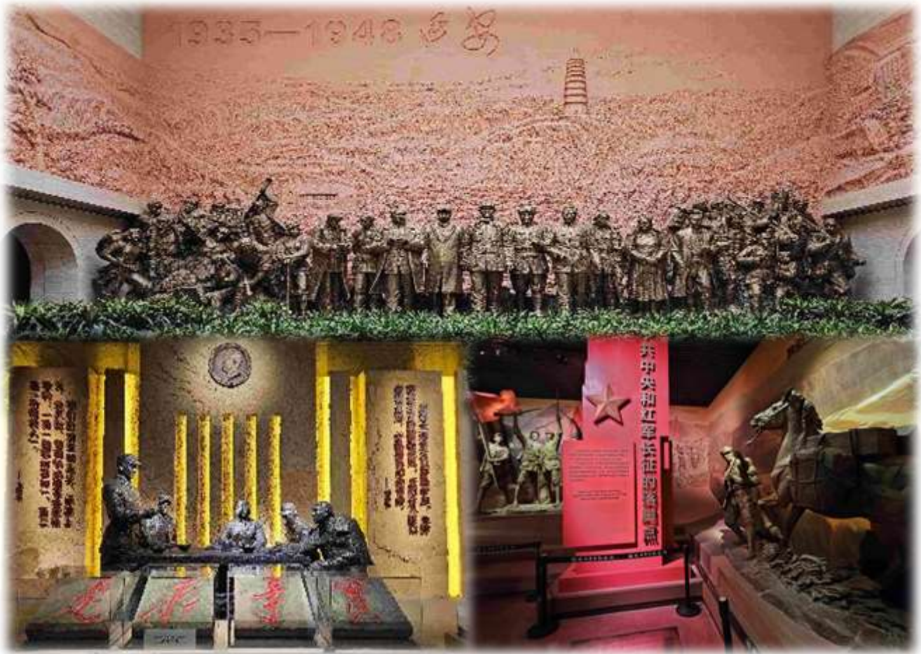
จีน และหอที่ระลึกการผลิตขนานใหญ่หนันหนันวัน

เข้าชมพิพิธภัณฑ์ศิลปะการปฏิวัติของจีน ซึ่งรวมถึงพิพิธภัณฑ์ศิลปะการปฏิวัติของ