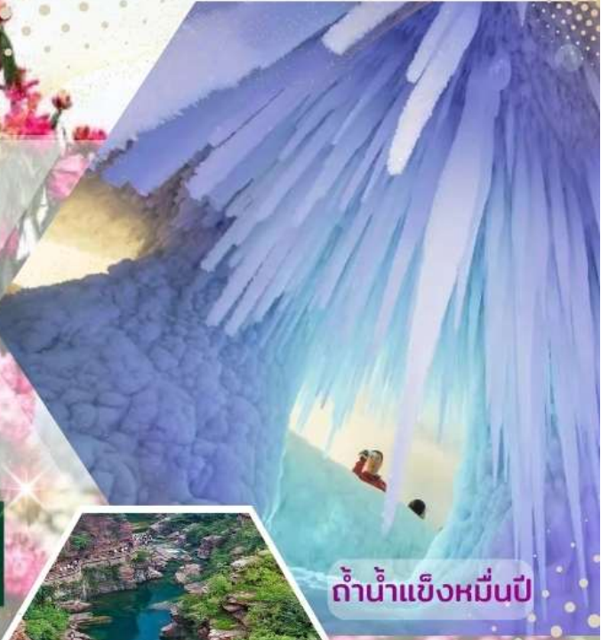
ถ้ำน้ำแข็งหมื่นปี