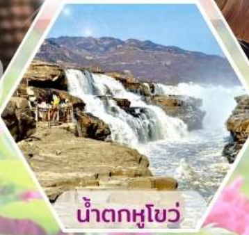
น้ำตกหูโซ่ว