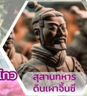
สุสานทหารดินเผาจีนซี