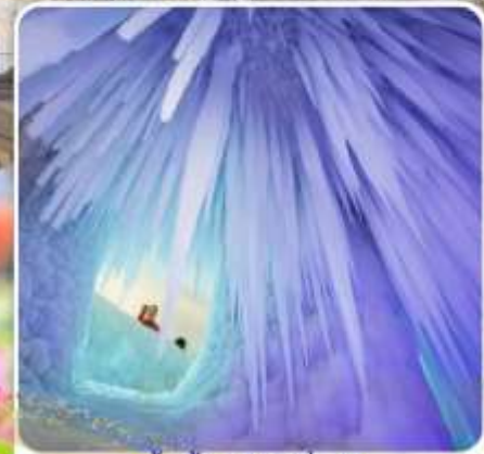
ถ้ำน้ำแข็งหมื่นปี