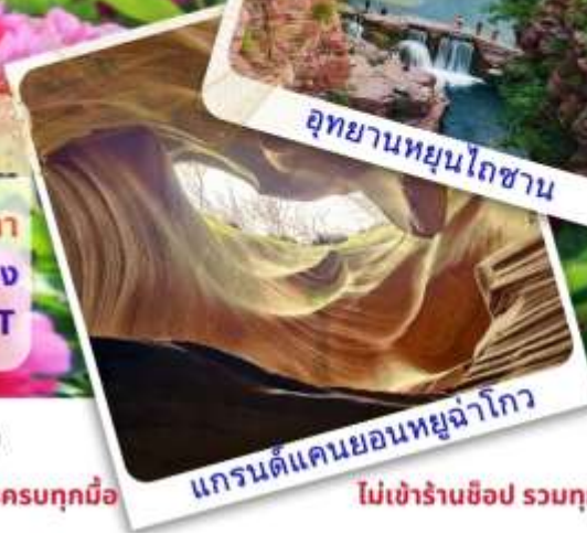
แกรนด์แคนยอนหลั่วโกว