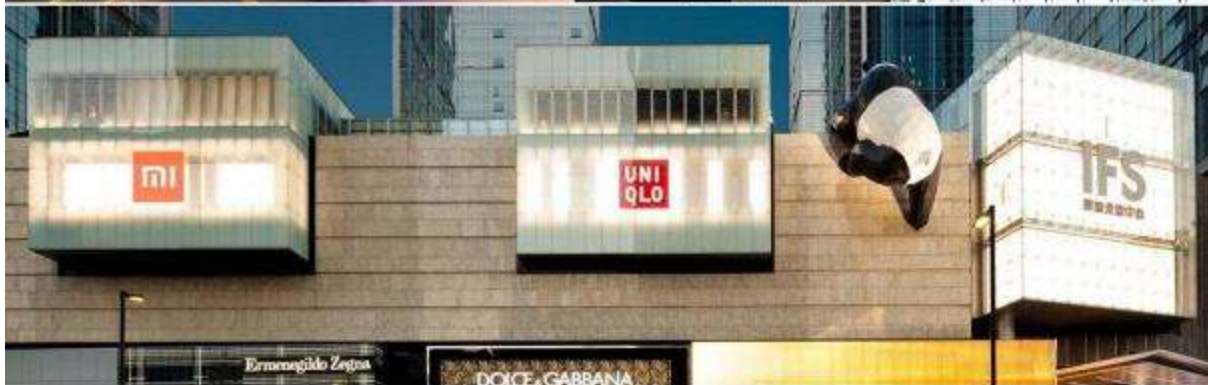
นำท่านสู่เช็ควิน หมีแพนด้ายักษ์ปักกิ่ง (IFS BUILDING) แพนด้ายักษ์สุดแสนน่ารักกำลังปักกิ่ง เป็นประติมากรรมแพนด้ายักษ์แขวนอยู่บนอาคาร IFS ใจกลางเมืองเฉิงตู มีแหล่งช้อปปิ้งมากมาย

🍴 รับประทานอาหารเย็น มื้อที่ 13 #สนุกหม่าล่า ✅