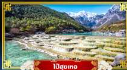
ปี่สุยเทอ