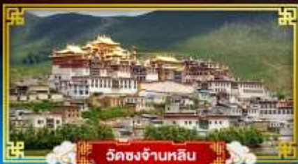
วัดชงจ้านหลิน

เยือนแหล่งมรดกโลกและเมืองเก่าสุดคลาสสิก “นั่งกระเช้าขึ้นภูเขาเฉิมะม้งกรดยก”