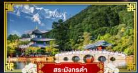
สะพานมังกรดำ