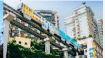
รถไฟฟ้าทะเลตุ๊ก

*ทางบริษัทฯ ขอสงวนสิทธิ์ในการสลับโปรแกรมทัวร์ตามความเหมาะสมขึ้นอยู่กับสถานการณ์ปัจจุบัน โดยคำนึงถึงผลประโยชน์ของลูกค้าเป็นหลัก