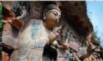
พาคินแกะสลักต้าจู้ เขาเป่าตึงซาน