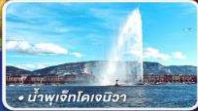
• น้ำพุเจ็กโคเจนิวา

นั่งรถไฟด่วนกราชียเอ็กซ์เพรสระดับเฟิร์สคลาส ขึ้น 4 เหน่าดังแห่งสวิส อาบน้ำแร่พักในเมืองลูเกอร์บาด