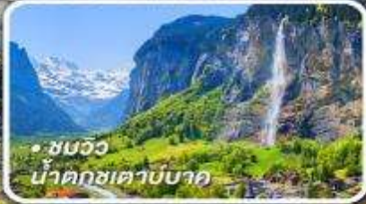
• ชมวิว น้ำตกเซาบาค

กับรถไฟด่วนขบวนสวรรค์ เซอร์แมท-อันเดอร์แมท