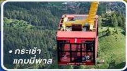
• กระเช้า แกมมีพาส