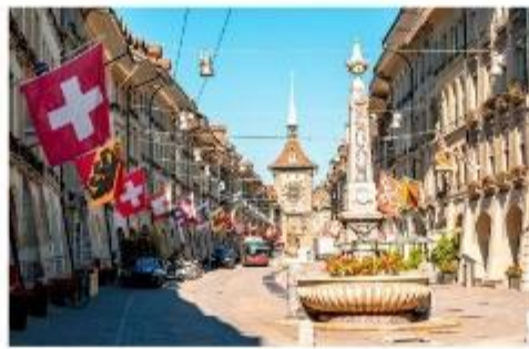
มาร์กาเซ ย่านเมืองเก่า

นำท่านชม บ่อหมีสีน้ำตาล สัตว์ที่เป็นสัญลักษณ์ของกรุงเบิร์น นำท่านชม มาร์กาเซ ย่านเมืองเก่า ปัจจุบันเต็มไปด้วยร้านดอกไม้และบูติก เป็นย่านที่ปลอดภัย จึงเหมาะกับการเดินเที่ยวชมอาคารเก่า อายุ 200-300 ปี นำท่านลัดเลาะชม ถนนจุงเคอร์นกาเซ ถนนที่มีระดับสูงสุดของเมืองนี้ ซึ่งเต็มไปด้วยร้านภาพวาดและร้านขายของเก่าในอาคารโบราณ ชม นวมฟาใช้ทคล็อคเค่นทรัม อายุ 800 ปี ที่มีโชว์ให้ดูทุกๆชั่วโมงในการตีบอกเวลาแต่ละครั้ง นวมฟานี้ ในช่วงปี ค.ศ. 1191-1256 ใช้เป็นประตูเมืองแห่งแรก ภายหลังได้ดัดแปลงใช้ทคล็อคเค่นทรัมให้กลายมาเป็นหอนวมฟาพร้อมติดตั้งนวมฟาดาราศาสตร์เข้าไป