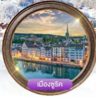
เมืองซูริก