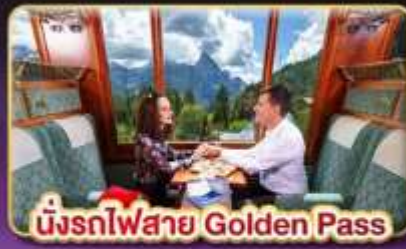
นั่งรถไฟสาย Golden Pass