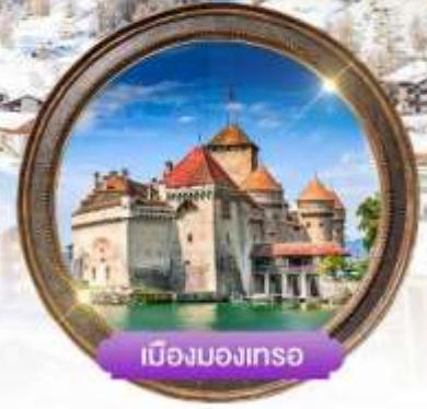
เมืองมงเทรซ