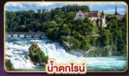
น้ำตกโรน