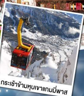
กระเช้าข้ามหุบเขาแกมมีพาส