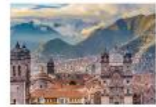
ย่านเมืองเก่าคุซโก้

** พักที่ San Agustin La Recoleta Hotel 4* หรือเทียบเท่า **