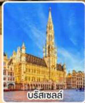
บรีซาเซล

พิเศษ!! เมนู หอยแอสคาโต้, จากหมู่บ้าน หอยแมลงภู่อบไวน์ขาว