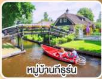
หมู่บ้านทึร์น