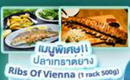
เมนูพิเศษ!! ปลากระต๊อ Ribs Of Vienna (1 rack 500g)