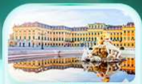
พระราชวังเซินบรุนน์