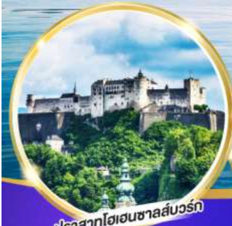
ปราสาทไฮเซนซาลส์บวร์ก