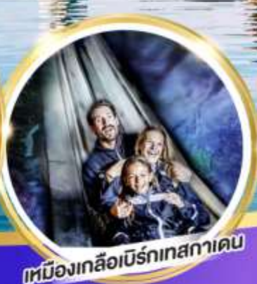
เหมืองเกลือบิรท์เทศาเคน