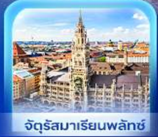
จัตุรัสมาเรียนพลัทซ์

เวียนนา ปราสาทนอยชวาสไตน์ ลูเซิร์น เซอร์แมท ชุก ซูริก