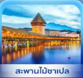
สะพานไมซ์าเปลา