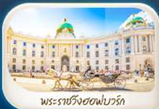
พระราชวังฮอฟบวร์ก

เดินทาง 12-18 มี.ค.68 / 19-25 มี.ค.68 28 เม.ย. - 4 พ.ค.68 7-13 พ.ค.68