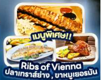
เมนูพิเศษ!! Ribs of Vienna ปลาเทราสย่าง, บาหมูเยอร์มัน