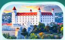
ปราสาทปราตีสลวา

เที่ยวชมเมืองอัลส์ดัทท์ หมู่บ้านริบทะเลสาบสวยที่สุดในโลก พระราชวังเซินบรุนน์ เมืองลินซ์ จิตรกรรมฝาผนังยักษ์ สัมผัสเมืองมรดกโลก เซสท์ ครุมลอฟ เยี่ยมชมปราสาทปราก ถนนทองคำ เชิ่คอินสถานที่ชื่อดัง! ปราสาทปราตีสลวา ส่องเรือชมความงามแม่น้ำดานูบ แม่น้ำที่ยาวที่สุดในยุโรป ชมความน่าหลงใหลอง ปราสาทบูคาเปสต์ สะพานชาร์ลส์