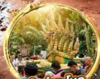
ป่าคำชะโนด