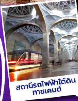
สถานีรถไฟฟ้าวัดดิน ทาชเคนต์