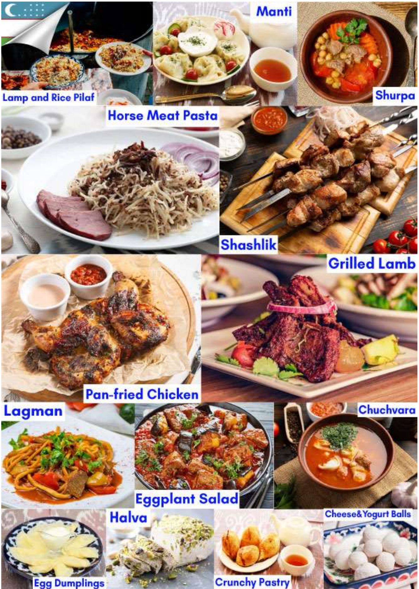
Lamp and Rice Pilaf