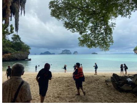
ถ่ายรูปเกาะไก่ ลงเล่นน้ำ เกาะไก่ ชมปะการังหลากสี ปลาการ์ตูน และ ปลานานาชนิด