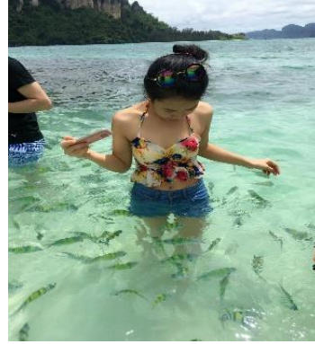
ชมทะเลแหวก Unseen in Thailand เชื่อมระหว่าง เกาะทับ และ เกาะหม้อ