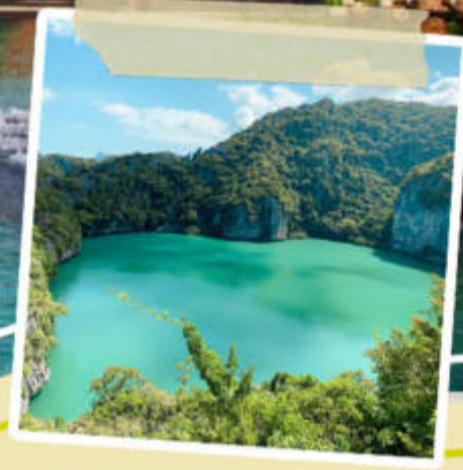
ราคานี้รวม