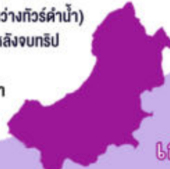
เกาะเต่า