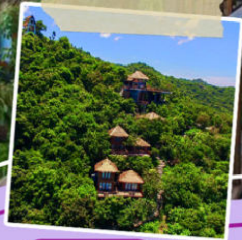
ราคานี้รวม