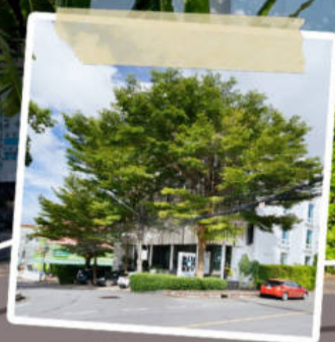
ราคานี้รวม